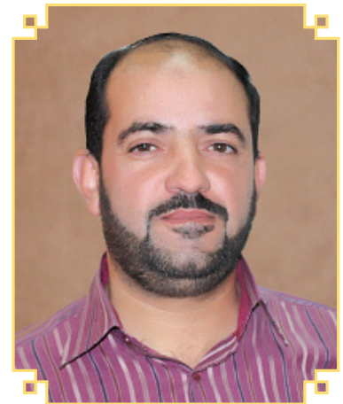
السيد ياسر عادل المحاميد رئيس الديوان