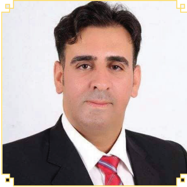
السيد محمد عاطف علي السلامين رئيس الديوان