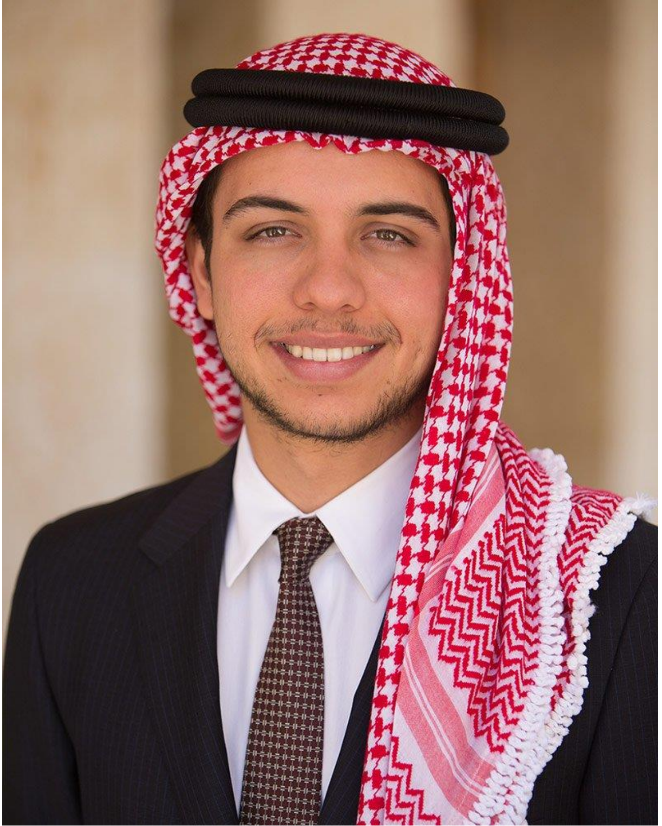
صاحب السمو الملكي الأمير الحسين بن عبد الله الثاني ولي العهد المعظم