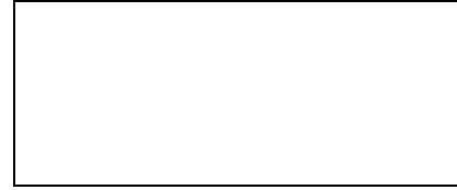
شكل (1-5) .....